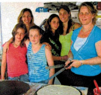
Eiskunstläuferinnen: Baken Crêpes