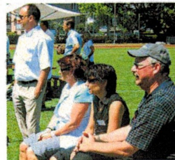
Politiker: Verfolgt den Behördenmatch