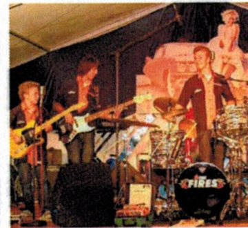
«The Fires»: Im Zelt der Golden Oldies