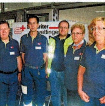
Im Einsatz: Samariterverein Dorf