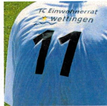
Behördenfussball: Wettigen siegte